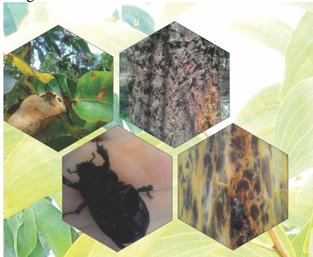
Gambar 2. Jenis hama/organisme pengganggu tanaman, penghisap pucuk, penggerek batang (Sumber : laporan HPT PT. Acacia Andalan Utama)

Dalam upaya pengendalian populasi hama dan penyakit di tegakan, operasional plantation akan mengkombinasikan metode-metode pengendalian yang ada secara kompatibel, yaitu penggunaan lahan tanam yang terseleksi dari kontaminasi hama dan penyakit serta memiliki pertumbuhan yang baik, pengendalian secara silvikultur (pengaturan jarak tanam, pemupukan, sanitasi areal/penyiangan), penggunaan agensia hayati (cendawan Trichoderma sp., Glyocladium sp., Beauveria bassiana ) dan aplikasi pestisida sebagai langkah/alternatif terakhir.